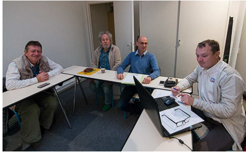
Commission Photo-Vidéo, tel est le nouveau nom de « l'Audiovisuelle »