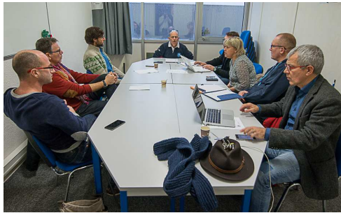
Nage Avec Palme et Apnée font salle commune

Ceux qui ne connaissent de l'AG des commissions que le résumé présenté durant l'après-midi lors de l'AG du Comité ne peuvent pas se rendre compte du travail accompli durant la matinée.