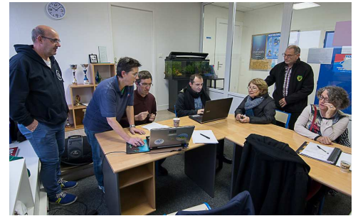
La Biologie a logiquement choisi de se réunir dans la salle appelée « l'aquarium »