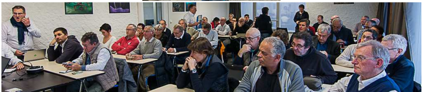
✎ Les derniers arrivants regagnent leur place et l'assistance est déjà attentive.