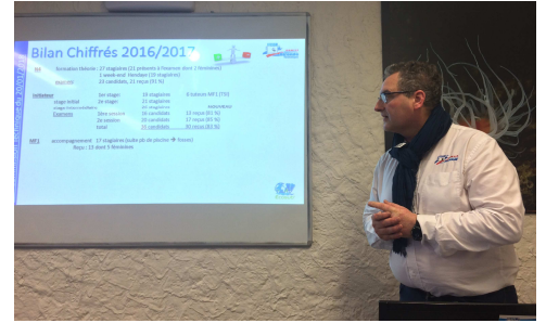
La Technique pousse loin le sens du détail

Ainsi vivent et progressent nos commissions, garantes de la pérennité des actions dans leur domaine.